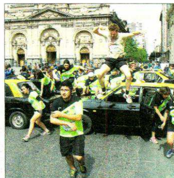
Más de 3.200 participantes tuvo el "Urbanatón", carrera con obstáculos en Santiago.