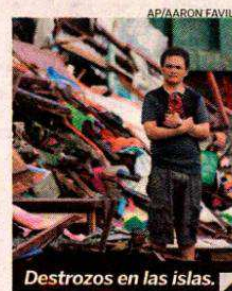
Destrozos en las islas.

El tifón "Haiyan" dejó al menos 10.000 fallecidos y 2.000 desaparecidos en su paso por Filipinas. El tifón azotó el viernes las seis islas del centro de ese país, donde destruyó edificios y arrasó con viviendas debido a sus vientos de 235 kilómetros por hora. Varios países comprometieron su ayuda para los afectados y la Unión Europea ofreció tres millones de euros.