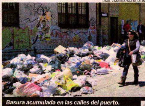
Basura acumulada en las calles del puerto.

Agregó que los operativos se mantendrán el tiempo necesario en el puerto, debido a que el paro de los funcionarios no tiene fecha de tér-