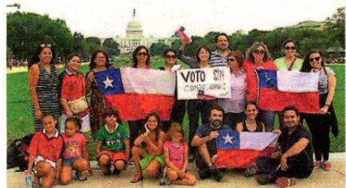
Parte de los chilenos que residen en Washington.