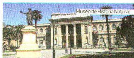
Museo de Historia Natural