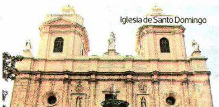
Iglesia de Santo Domingo