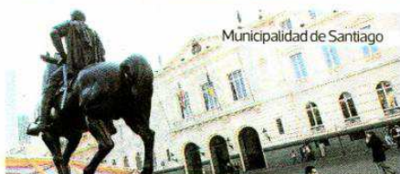
Municipalidad de Santiago