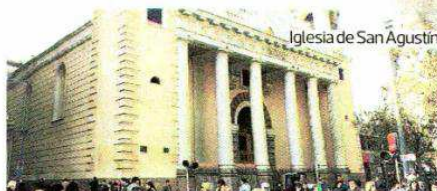
Iglesia de San Agustín