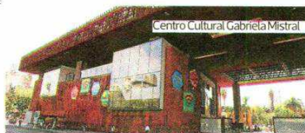
Centro Cultural Gabriela Mistral

Además, en el término de la competencia habrá un pequeño circuito de obstáculos, de 500 metros, para niños y talleres de reciclaje, donde se enseñará a dar un mejor uso a algunos de los materiales usados en la competencia, como los neumáticos, por ejemplo.●