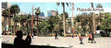
Plaza de Armas