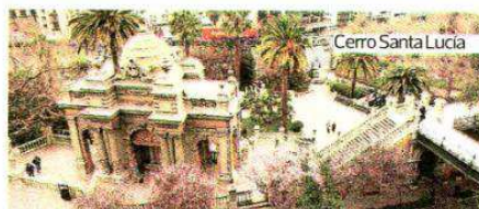
Cerro Santa Lucía