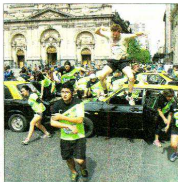
Más de 3.200 participantes tuvo el "Urbanatón", carrera con obstáculos en Santiago.