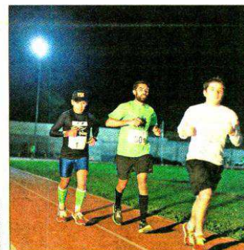
Extrema corrida de 24 horas finalizó sin problemas para los 40 valientes participantes.