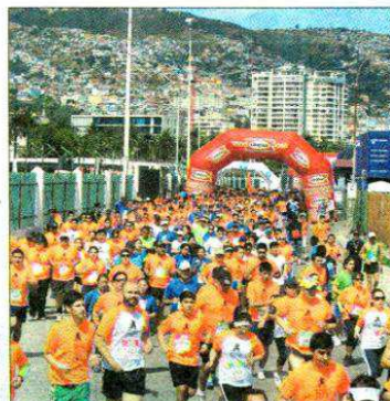
1.300 personas se reunieron frente al Muelle Barón en el Maratón de Valparaíso.