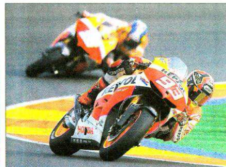
Aunque Jorge Lorenzo (Honda) ganó la carrera, no impidió que Márquez alcanzara la cima.