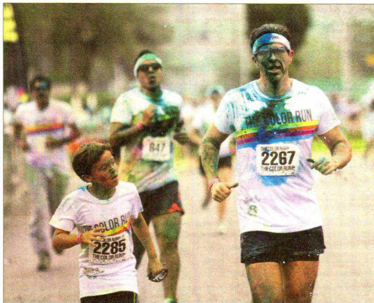
Así de jaspeados quedarán los corredores en The Color Run Costanera.

La Urbanatlón será el atractivo del domingo en Santiago Centro. "El runner habitualmente se encuentra en la ciudad con micros, tráfico, hoyos. Esta será su venganza, porque podrá pasar por sobre buses del Transantiago, corridas de taxi, piscinas, neumáticos. Serán 8k a través de una ruta patrimonial con diez estaciones de obstáculos. Será un espectáculo para los corredores y también para los que miren", detalla Víctor González de Aventura Aconcagua.