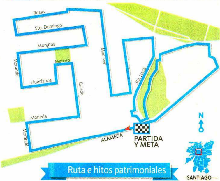
Ruta e hitos patrimoniales